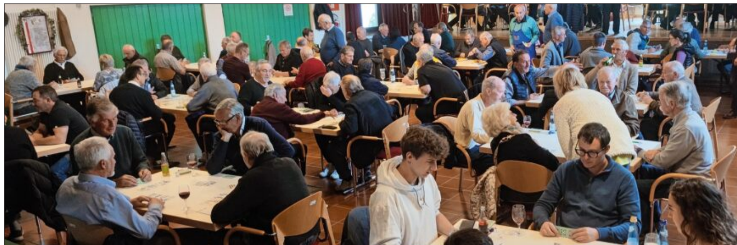
Volle Konzentration war gefragt, um bei der Landesmeisterschaft im Perlaggen erfolgreich zu sein.