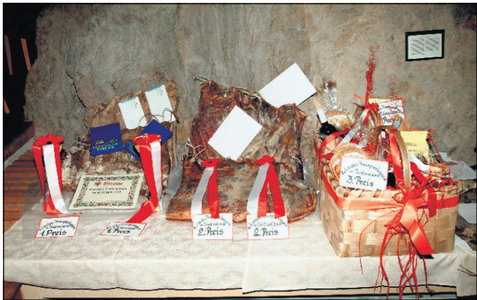
Kulinarisches als Preise: Speck für die beiden Erstplatzierten und die Zweiten sowie ein Geschenkkorb für die Drittplatzierten.