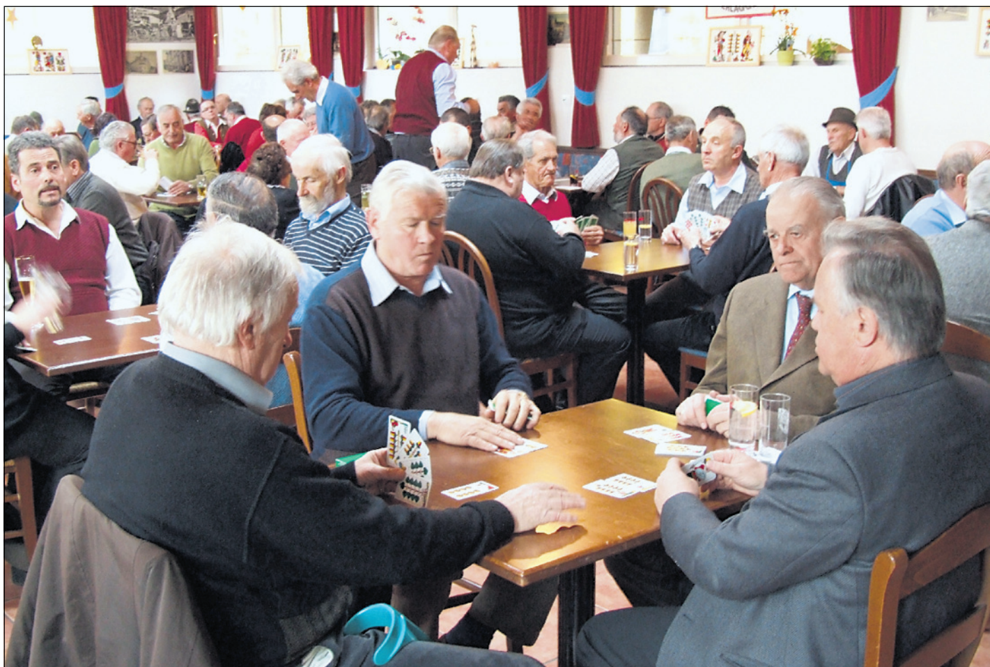
Konzentration pur: 104 Spieler beteiligten sich an der fünften Landesmeisterschaft im Perlaggen, zu der der Förderkreis Perlaggen Bozen am vergangenen Samstag nach Auer geladen hatte.