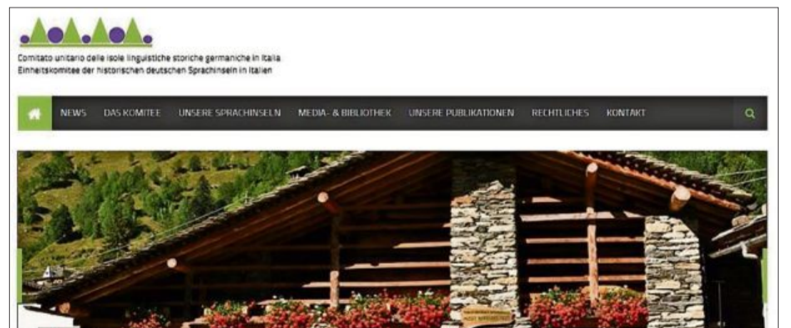
Die Homepage (im Bild) des Sprachinselkomitees bietet viele interessante Informationen.

Inhaltlich sind neue Normen aus Europa und Italien eingebaut worden, so z. B. der EU-Beschluss über ein Europäisches