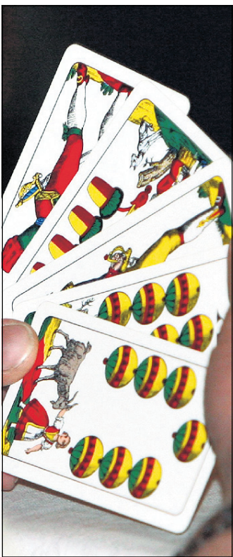
Einen „Perlogger“ hat dieser Spieler ja schon einmal...

PERLAGGEN-LANDESMEISTERSCHAFT / Solidarität