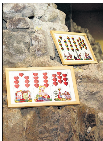
Passende Wanddekoration: „Honger“ zierten die Felsen.