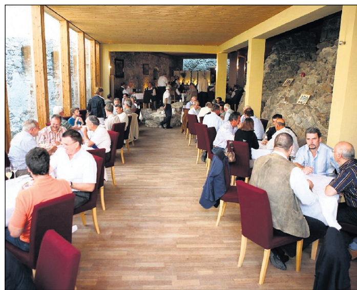
Ein Saal voller Perlagger: Der Förderkreis „Perlaggen in Südtirol“ möchte dieses alte Spiel durch Gratiskurse wieder verbreiten.