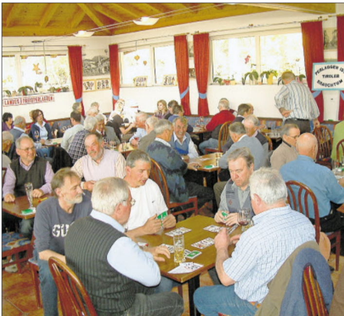
120 Spieler beteiligten sich an der 6. Südtiroler Landesmeisterschaft im Perlaggen.