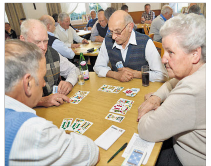
Das Perlaggen ist nicht nur Männersache: Unter den 116 Teilnehmern an der 9. Landesmeisterschaft im Restaurant „Steiner“ in Leifers waren auch sechs Frauen.