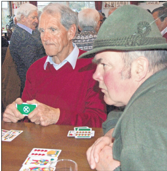
Perlaggen ist ein Spiel für Denker, und es ließ so manchen auch richtig grübeln.