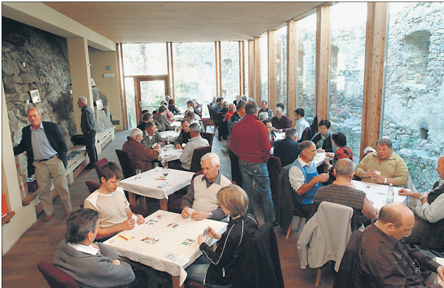
Über fünf Stunden lang wurde auf der Haselburg gespielt. 56 Paare hatten sich fürs Perlaggen gemeldet.