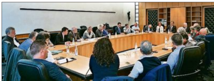
Beim Gespräch der Sozialpartner und Landesvertreter zum Zusatzvertrag für die Mitarbeiter der öffentlichen Busdienste.

BOZEN (LPA). Die Sozialpartner haben sich getroffen, um mit den Landesvertretern weiter über einen Zusatzvertrag für die Mitarbeiter im öffentlichen Busdienst zu beraten.